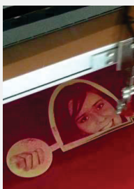
Rezanje i čišćenje

- radni prostor s opcionalno Roll to Roll Autofeeder jedinicom koja je najbolji izbor za automatizaciju i čišćenje na rolnama.