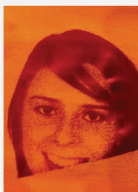
Uklonite foliju, gotovo!

Čuvati na hladnom i suvom mjestu, zaštićenom od uticaja svjetla. Savjetujemo vam da ne prekoračite predviđeni period upotrebe od 36 mjeseci. Tehničke specifikacije oslanjaju se na brojne testove i tehničke resurse. Zbog raznih mogućih uticaja tokom refiniranosti i upotrebe, specifikacije treba posmatrati kao referentne vrijednosti. Preporučujemo prikladni test na originalnom materijalu. Pravno obvezujuća garancija specifičnih karakteristika ne može biti izvedena iz naših specifikacija.